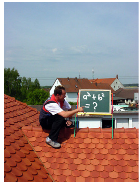
Das Dach muss nicht das Ende der Karriereleiter für den Dachdecker sein.

Aber auch der Dachdecker, der seine weitere Ausbildung mit der Meisterschule abschließt, kann beruhigt nach vorne schauen. Mit dem „Großen Befähigungsnachweis“ in der Tasche kann er seinen eigenen Betrieb gründen oder einen in der Branche bereits etablierten Betrieb übernehmen. Dabei ist schon jetzt sicher: Mit dem Fachkräftemangel von heute steigen die Karrierechancen für die Meister von morgen. Und selbst wenn kein eigener Betrieb gegründet wird: Deutsche Dachdecker gehören weltweit zu den gefragten Spezialisten für die gesamte Dach-, Wand- und Abdichtungstechnik.